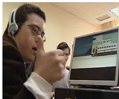
Un videojuego adaptado para 'síndromes'

La elaboración del videojuego ha sido llevada a cabo por completo por el equipo de psicólogos educativos de la Fundación Síndrome de Down de Madrid, encargados de fijar los objetivos y diseñar los escenarios y los puzzles.